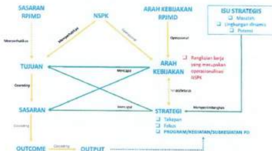
Gambar 3.1 Konsep Renstra Dinas Pendidikan Kota Tanjungbalai

Dalam rangka mewujudkan visi dan misi pembangunan Kota Tanjungbalai tahun 2025–2029, penyusunan Rencana Strategis (Renstra) Dinas Pendidikan menjadi langkah penting untuk memastikan bahwa semua program dan kegiatan yang dilaksanakan dapat menjawab tantangan dan permasalahan yang ada, memperhatikan isu-isu yang berkembang serta dapat memberikan manfaat maksimal bagi masyarakat. Rencana Strategis Dinas Pendidikan mengacu pada RPJMD Kota Tanjungbalai, maka otomatis Renstra Dinas Pendidikan juga mengacu pada dokumen perencanaan yang di atasnya yaitu RPJPD Kota Tanjungbalai tahun 2025-2045. Kedudukan dan keterkaitan antar dokumen perencanaan dalam sistem perencanaan pembangunan dan sistem keuangan dapat dilihat dalam bagan sebagai berikut: