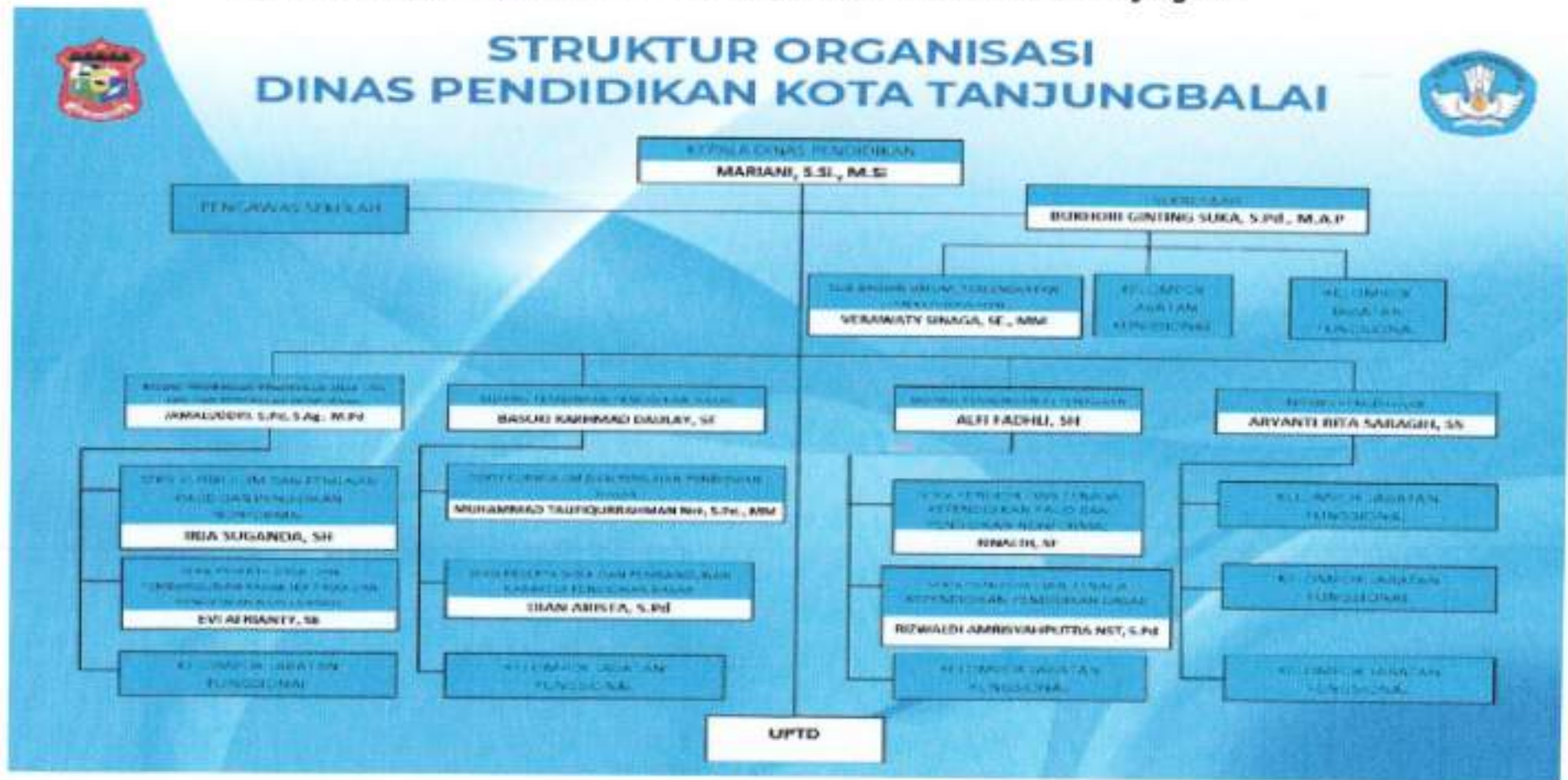
Gambar 1. Susunan Organisasi dan Tata Kerja Dinas Pendidikan Kota Tanjungbalai